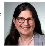
Colecho y lactancia: los riesgos reales y las discrepancias Melissa Bartick, MD, MSc, FABM