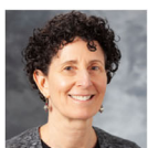
Comiendo de mamá – cómo influye la dieta materna en la leche humana Anne Eglash, MD, IBCLC, FABM

Solicitado al IBLCE los créditos de Reconocimiento de Formación Continuada para Consultores de Lactancia (CERPs)